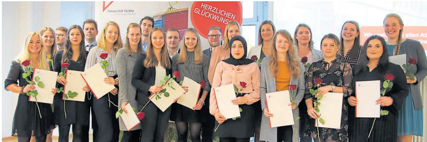
Die Absolventen und -innen des Studiengangs „Management Sozialer Dienstleistungen“ an der Universität Vechta freuen sich über ihren Abschluss.

So erreichen Sie die Redaktion: Tel.: 04471/99882800, E-Mail: red.vechta@nwzmedien.de